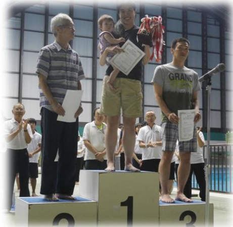
優勝：ミネラルウォーターズ