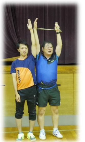
紐を使っただけで肩の可動域が広がる!!

講義終了後に、閉会式が行われ受講者全員に修了証が渡され第3回関東ブロックセミナーは無事終了しました。次回は2020年のオリンピックの年に埼玉県連盟主管(予定)で開催されます。