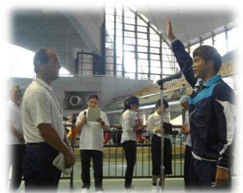
明治薬科大学チームの選手宣誓

東京五輪開催の影響で辰巳国際水泳場がしばらく利用できなくなります。また辰巳国際水泳場のすぐ横にオリンピックアクアティクスセンターが新設されます。五輪後この2つ水泳場が、水泳愛好者の皆さんにとって利用しやすい環境となるよう東京水泳協議会、東京都連盟は東京都に対して要望、要請を行っていく予定です。読者の皆さんからも五輪後の利用方法や、併設となる東京辰巳国際水泳場とアクアティクスセンターについて御意見等を東京都連盟まで是非お寄せください。(宮内泰明)