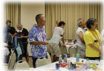
交流会での大合唱♪