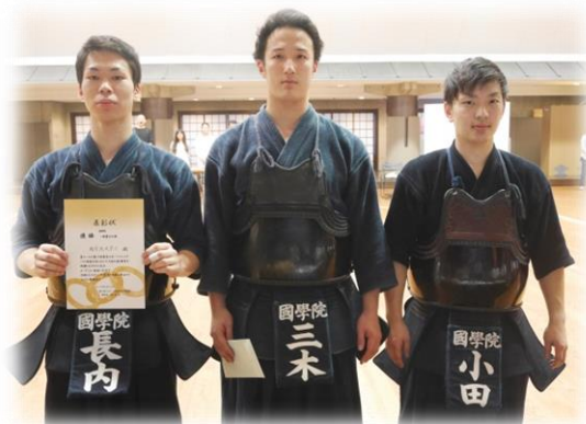
國學院大学Aの皆さん