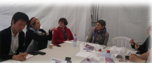
男女共同スポーツのフォーラム

午後からは体育館内でオムニスポートのテニス、屋外でダブルダッチ(縄跳び)、大きな布?を利用して大人数で楽しむ遊び等を体験。