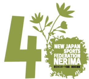
戸島氏デザインのロゴ

1976年の6月に結成された新日本スポーツ連盟練馬区連盟は本年40才の誕生日を迎えました。5月29日(日)に歴代の理事の皆さんやご協力者を招き、クラブ員の皆さんとともに練馬区連盟40周年祝賀会を開催しました。その中で「写真で辿る40年」を制作、上映し先輩たちの活動の歩みを振り返りました。30年以上継続して活動しているクラブが三原台かめのこ水泳クラブ、ウィンテニスクラブ、ジャムホーステニスクラブの3クラブがあり、全国連盟50周年にクラブ表彰を受けま