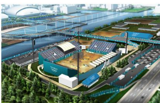
夢の島公園の野球場と陸上競技場を取り壊して作られる予定の馬術場完成イメージ

今ある都民のスポーツ施設(野球場20面、テニスコート14面)が、オリンピックのために造り替えられてしまう現状や、カヌー・スラロームの競技場を造るために、葛西臨海公園の自然を破壊したのでは、オリンピックの理念から外れてしまうので、開催計画の段階では他の場所に移すなど、必ず変更しなければならない要件です。オリンピックのために大型開発が大手をふるい、都民生活は疲弊するのでは、それも大義から外れます。震災復興や放射能汚染の処理に至っては、最優先課題として国をあげて取り組まなくてはなりません。