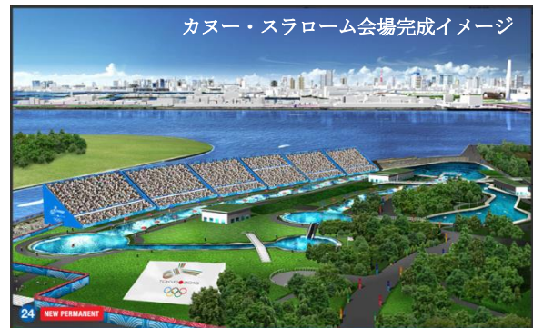
カヌー・スラローム会場完成イメージ

終わってみれば、大型開発の付けが都民にのしかかったのでは困ります。大イベントをやったけれども、「人々の権利」としてのスポーツ環境は、なにも変わっていないのでは、オリンピック・パラリンピックを開催した功績がなにも残らない。オリンピック運動の根本原則は、「世界の平和、人類の友好」「スポーツは人々の基本的権利」です。このことを真正面に据えた東京オリンピックにすることが最も大切なことです。