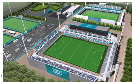
大井ふ頭中央海浜公園野球場を取り壊して作られる予定のホッケー場完成イメージ

憲法9条を守り、世界に類のない平和憲法を守るなかで、世界とアジアから信頼と友好の絆を深める「2020年東京オリンピック」が開かれることを期待せずにはいられません。