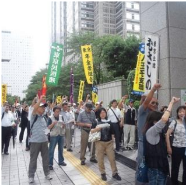
都庁に向かってシュプレヒコール