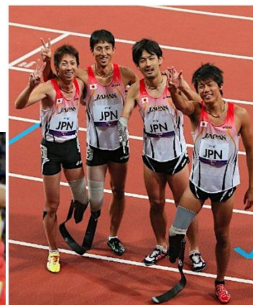
右から2番目が多川選手