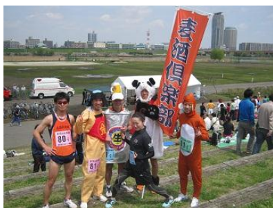
麦酒倶楽部の皆さん

東京以外の遠方から参加というチームも多く、「楽しかった」「また来年も参加したい」との声も多く聞くこともできました。チーム一丸となってゴールを目指し、それぞれの達成感と思い出を胸に参加選手の皆さんは会場をあとにしました。今大会では幸い事故や負傷する選手もなく運営面でも無事終えることができました。また会場で東日本大震災復興支援募金も行われ参加者や関係者から40,326円の温かい支援が集まりました。(宮内)