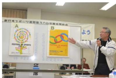
萩原都連盟理事長による開票風景

また2日目には第29回全国スポーツ祭典(2012年10月～2013年3月)のポスター案A・B(下記写真)の開票も実施され64票対71票の僅差でB案が採用されました。