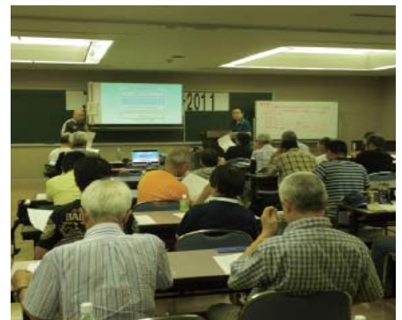
II部のビデオ上映・解説の様子