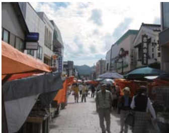
能登半島を丸1日かけて一周し、輪島の朝市では新鮮な海の幸を頂きました。