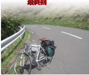
青森県下北半島にてうねりにうねった急こう配を息をきらせて上りました。