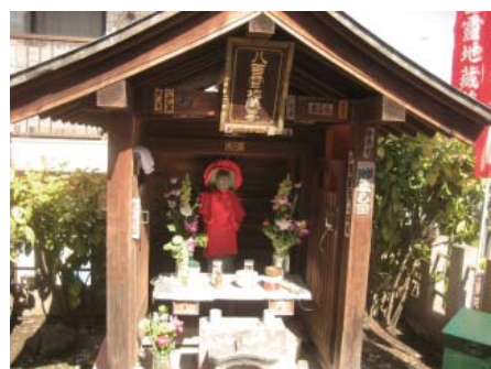
街の至る所に亡くなった方を供養する場所が