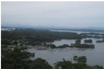
自転車を降りて丘から眺めた奥松島の絶景