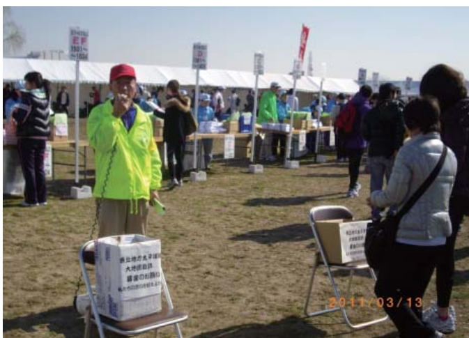
3月13日に川崎ハーフマラソンで行われた救援募金活動の様子