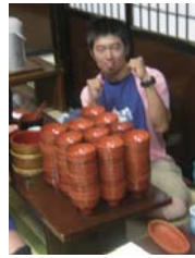
盛岡市でわんこそばという食文化を堪能