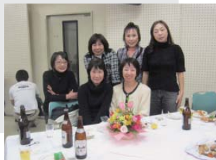
表彰式では参加された全ての入賞者が表彰を受けました。

総会には初めて参加しましたが、アットホームな感じがいいですね。強い人だけが楽しむのではなく、初心者や未経験者でもスポーツを楽しむことができるのがスポーツ連盟の良さだと思います。