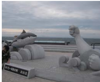
本州最北端大間岬からは北海道が臨めました