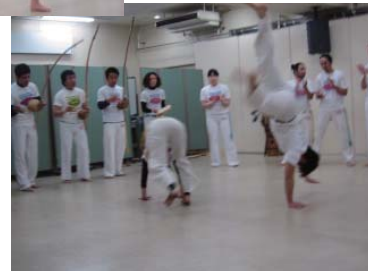
カポエイラの実演の様子。楽器を鳴らしながらにぎやかに行われました。