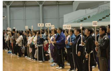
各都道府県代表がズラリと勢ぞろい

8年ぶりに東京で開催する今大会は、新築の墨田体育館と愛好者の憧れでもある東京体育館が会場なので、とても盛り上がると思います。全国の選手、愛好者の目標にされるように、選手のレベルと共に、規模、運営面でも最高のものを目指して頑張りたいです。