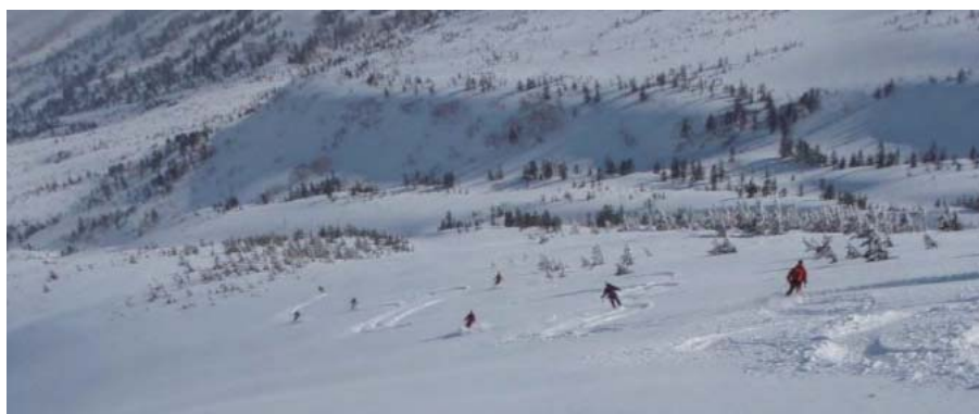
絶景が目の前に広がる大自然の中を自由に滑ります。自分だけのシュプールを描けます

今年も、すでに湯の丸高原や柵池高原で開催され、さらに月山（4月17日～18日）、至仏山（4月24日～25日）、八甲田山（5月2日～5日）、鳥海山（5月3日～5日）、立山（5月21日～23日）を予定しています。ぜひ、ご一緒に自然の中でスキーを楽しみましょう。（東京スキー協・長部）