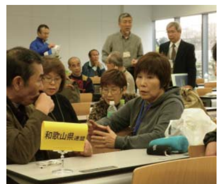
チャレンジ相談会での議論の様子