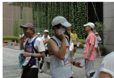
給水はこまめにとり、体調管理には万全を尽くします